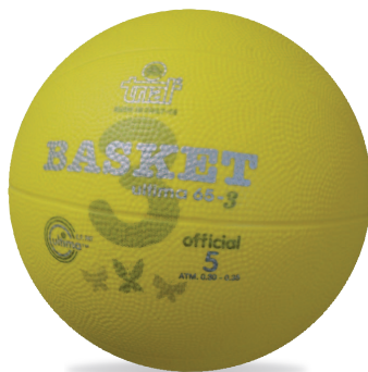
ULTIMA 65-3 Size 5