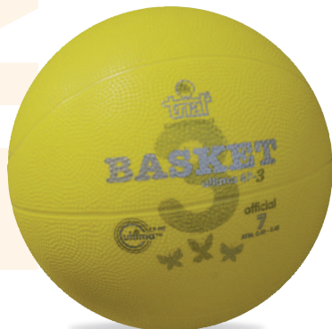
ULTIMA 67-3 Size 7