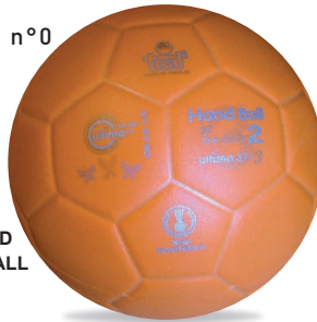
ULTIMA 37-3 Beach Handball M n°2

APPROVATI / APPROVED INTERNATIONAL HANDBALL FEDERATION