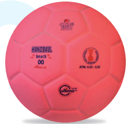
ULTIMA 34 Beach Handball n°00