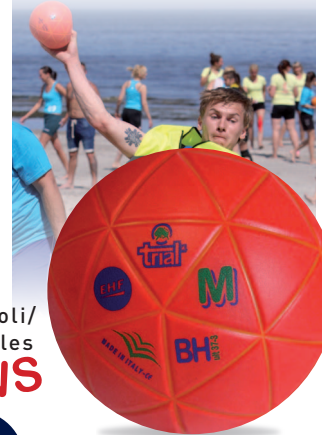
ULTIMA 37-3 Beach Handball M n°2