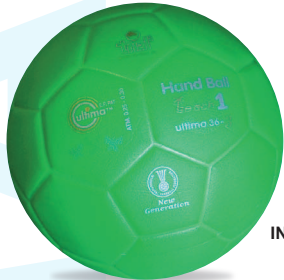
ULTIMA 36-3 Beach Handball F n°1