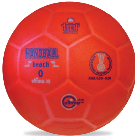
ULTIMA 35 Beach Handball J n°0