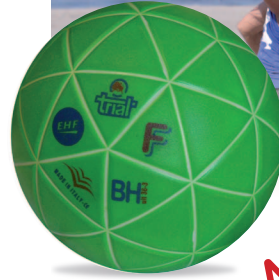
ULTIMA 36-3 Beach Handball F n°1