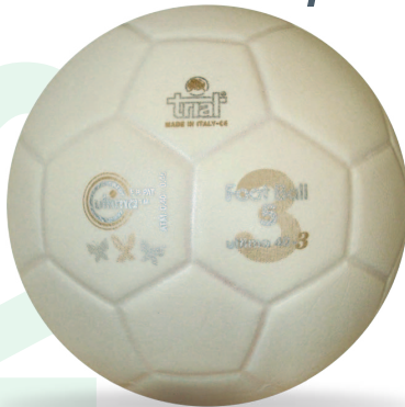
ULTIMA 40-3 Size 5