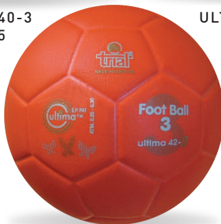
ULTIMA 42-3 Size 3