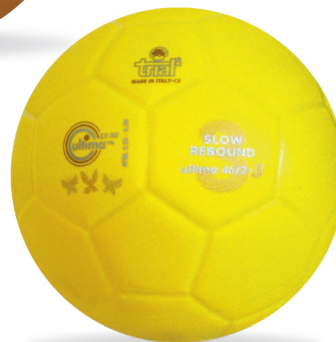
ULTIMA 46.2-3 Calcetto/Soccer Slow Rebound 2° livello/level