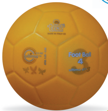
ULTIMA 41-3 Size 4