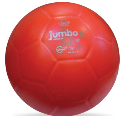
ULTBBS-3 Size 6 Jumbo

1. strato interno (struttura del pallone) in gomma reticolata vulcanizzata. 1. internal layer (ball's structure) in vulcanized reticulated rubber.