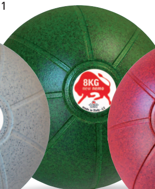
NEW NEMO 8