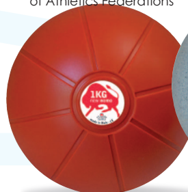
NEW NEMO 1