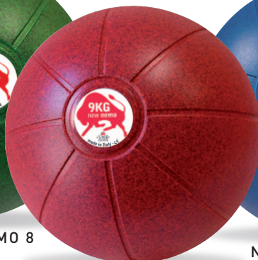
NEW NEMO 9