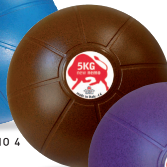
NEW NEMO 5