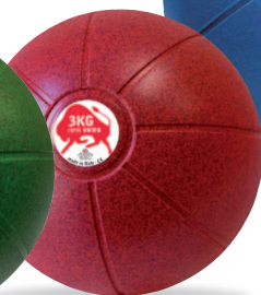
NEW NEMO 3