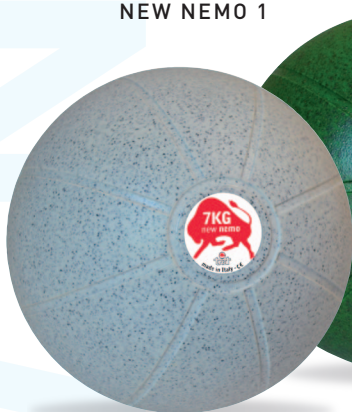
NEW NEMO 7