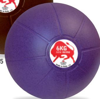
NEW NEMO 6