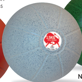
NEW NEMO 1,5