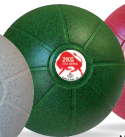
NEW NEMO 2