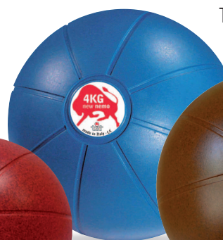
NEW NEMO 4